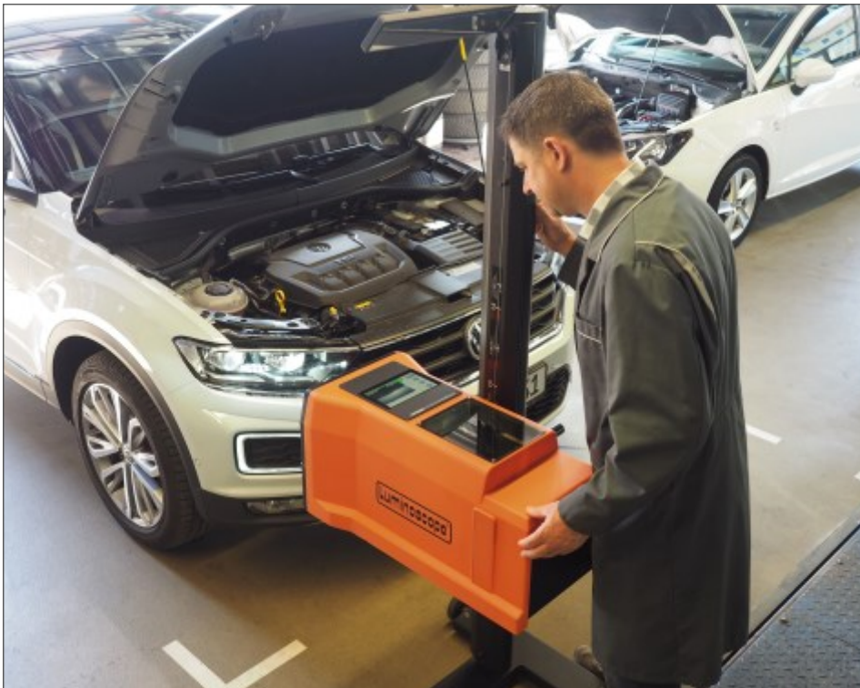
Digitales Scheinwerfer-Einstell-Prüfgerät (SEP) mit automatischem Nivellierausgleich